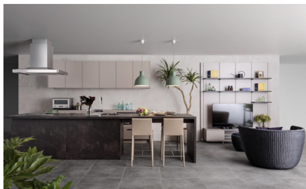
メルクリオ × アッシュベージュ

※カラーはCGイメージと異なります。 ※照明、チェアはスタイリング用のイメージです。