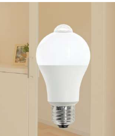
バッテリー内蔵センサー電球60W相当 昼光色