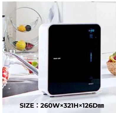
SIZE : 260W×321H×126Dmm